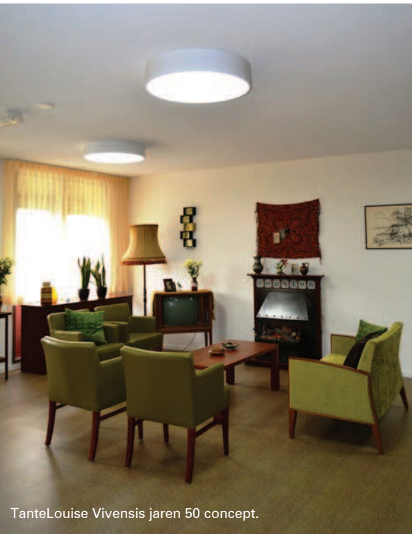
TanteLouise Vivensis jaren 50 concept.