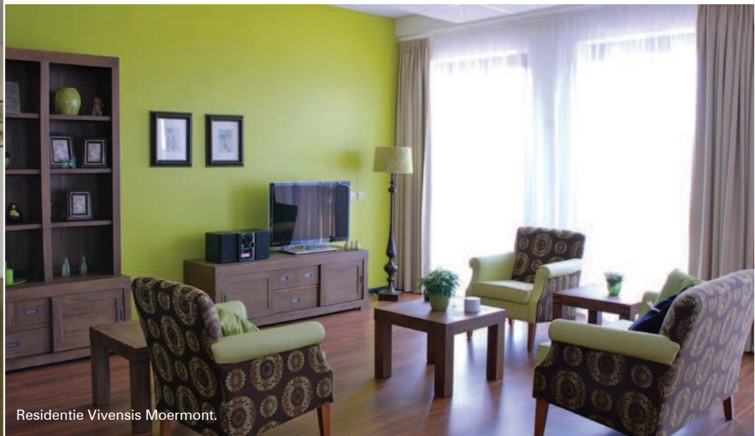
Residentie Vivensis Moermont.